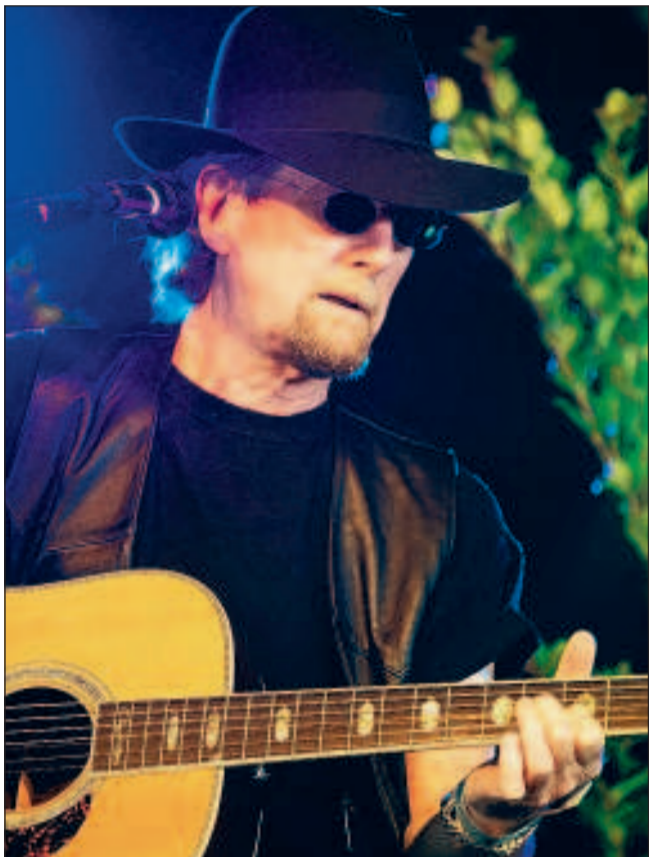
ROGER MCGUINN ★★★★★ Tijdloze Tamboerijnman