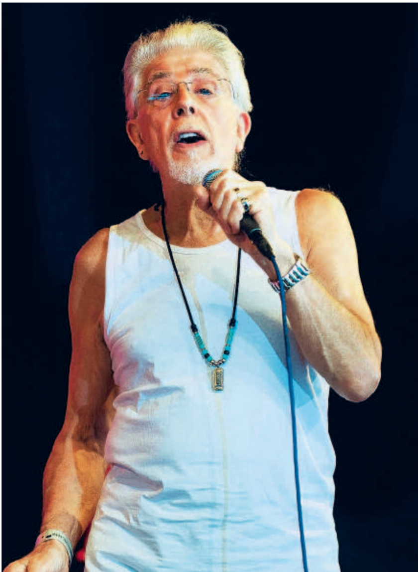
JOHN MAYALL ★★★★★ Steunbeer van de blues

Eigenlijk bleek alleen Pete Seegers 'Turn! Turn! Turn!' een smet op de set: in een rauwe soloversie, zonder glasheldere harmonieën bleef net iets te weinig over van de oorspronkelijke lijk song. Niet dat je het publiek één ogenblik hoorde morren: McGuinn kon zijn kamerbrede grijns dan ook in de coulissen verdween. (GVA)