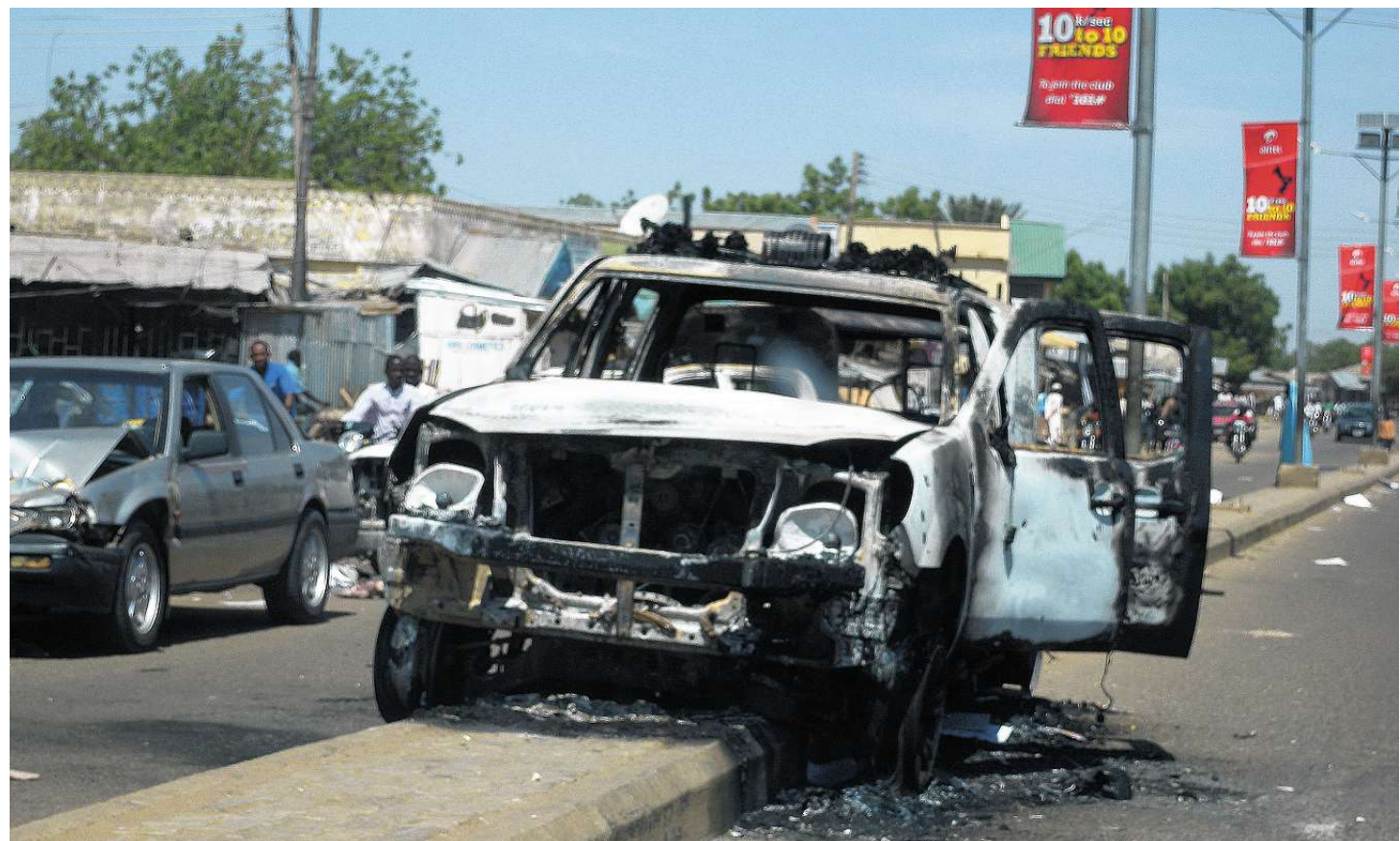
De serie aanslagen in Damaturu, in het noorden van Nigeria, is opgeëist door de islamitische sekte Boko Haram.

In het noordoosten van Nigeria heeft de radicale moslimsekte Boko Haram honderd mensen gedood. De VS waarschuwen voor aanslagen op luxehotels.