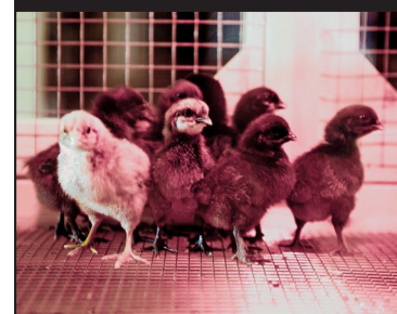
Kuikentjes van de vijftiende generatie, pas uit het ei.

VENETIË - Vanmechelen's solo-expo heeft een verlengstuk in het Berengo Centre for Contemporary Art and Glass op het eilandje Murano. Hier verblijven de Mechelse Silky-haan en twee Egyptische hennen die aan de basis liggen van de vijftiende generatie. Onder een lamp tijlen hun eerste tien nazaten, amper een week oud. JoM