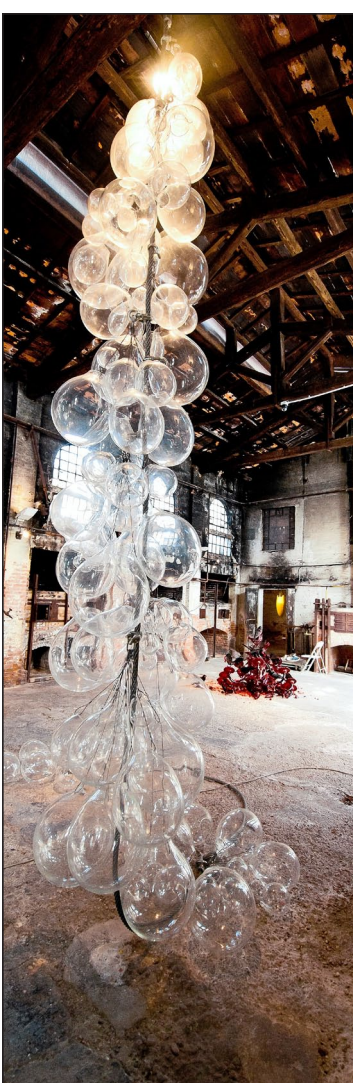
Glassculptuur van Koen Vanmechelen in het Berengo Centre, op het eilandje Murano.

De trappen op kom je in de broedkamer. Hier liggen in een incubator de eitjes waar straks de vijftiende generatie uit zal breken. Via een videoverbinding ziet de bezoeker bovendien de ouders van de kuikentjes, de Mechelse Silky-haan en zijn twee Egyptische hennen, scharen in hun hok op het nabijgelegen eiland Murano. "Reality-tv met kippen", lacht Vanmechelen. Maar hier wordt ook intellectueel gebroed, zoals Vanmechelen het noemt. Tijdens de Biënnale zullen wetenschappers tussen broedmachines en boekenrekken studies uitvoeren rond biodiversiteit (zie kader).