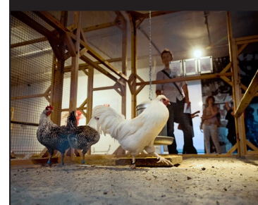
Mechelse Silky-haan met twee Egyptische hennen.