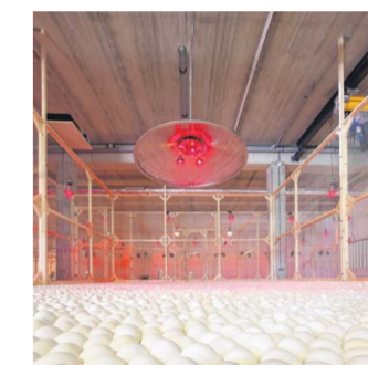
Breaking The Cage