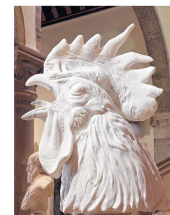
Nato A Venezia

In de schaduw van Triggerfinger: 'De rock-'n-roll stopt aan de voordeur.'