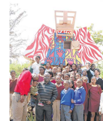
Cosmogolem foto: Koen Vanmechelen