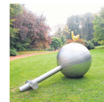
Salvator Globe foto: Koen Vanmechelen